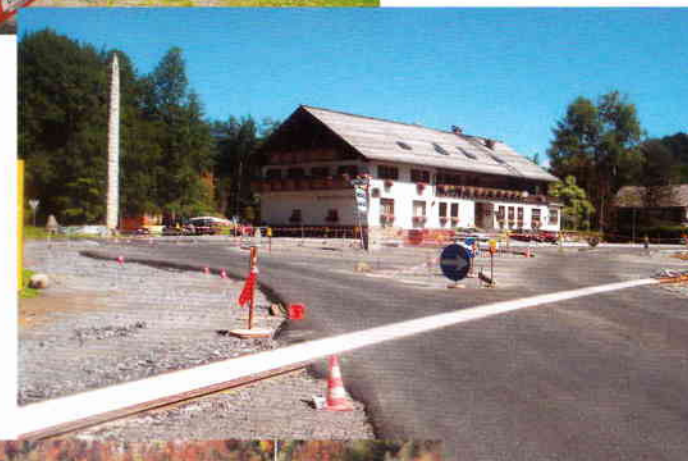
Neue Situation am Bahnübergang beim Bf. Schwarzenberg