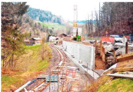
Baustelle an der Bahntrasse im Bereich Bf. Schwarzenberg

Das war jedoch noch nicht der erwartete Abschluss der Aktion. Sie fand durch den großen Erfindergeist der Kinder eine aufwändige Fortsetzung. Mehrmals musste die Vereinsmannschaft mit Werkzeug, Blechplatten und Schweißgerät auf die Entdeckung neuer Kletter- und Verletzungsmöglichkeiten reagieren.