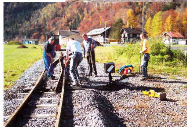
Stopfarbeiten an einem "goldenen" Herbsttag.