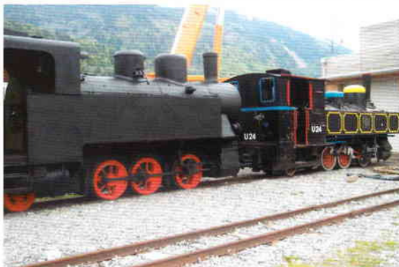
Der Austausch fand am 13. Mai 2005 statt. Eine Stunde lang waren in Bezau 4 Dampflokomotiven anzutreffen.

Das war jedoch noch nicht der erwartete Abschluss der Aktion. Sie fand durch den großen Erfindergeist der Kinder eine aufwändige Fortsetzung. Mehrmals musste die Vereinsmannschaft mit Werkzeug, Blechplatten und Schweißgerät auf die Entdeckung neuer Kletter- und Verletzungsmöglichkeiten reagieren.