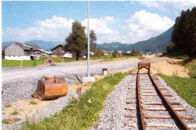
Neue Führung der L200 Richtung Bersbuch

Die aktiven Mitglieder haben sich am 8. Dezember, dem letzten Betriebstag der wechselvollen Saison 2005, im Gasthaus "Bezauer Hof" in