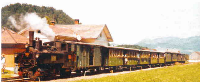
Zugsgarnitur mit der 'U 25' am Bf. Schwarzenberg und allen vier 'Stubaiierwagen', ein Bilddokument von 2004.