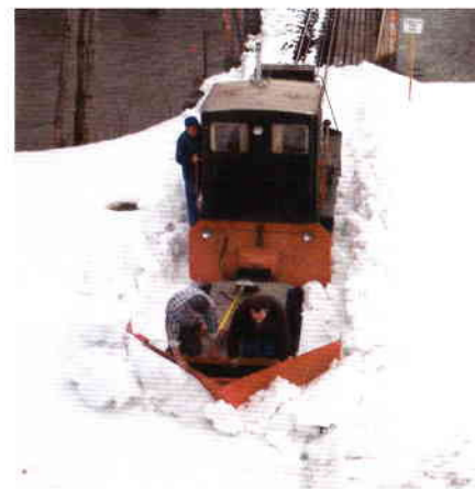
Die Diesellok "Hilde" Ende März 2005 mit dem Schneepflug und zugehöriger Räummannschaft nahe der Bregenzerachbrücke in Bezau.

Eine zweite Arbeitsgruppe hat sich unterdessen in Bezau mit der zeitraubenden Auswechslung von Weichenschwellen beschäftigt und auch Wartungsarbeiten an den Fahrzeugen durchgeführt.