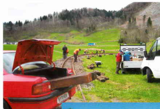
Schwellentransport auf "Wäldarisch"